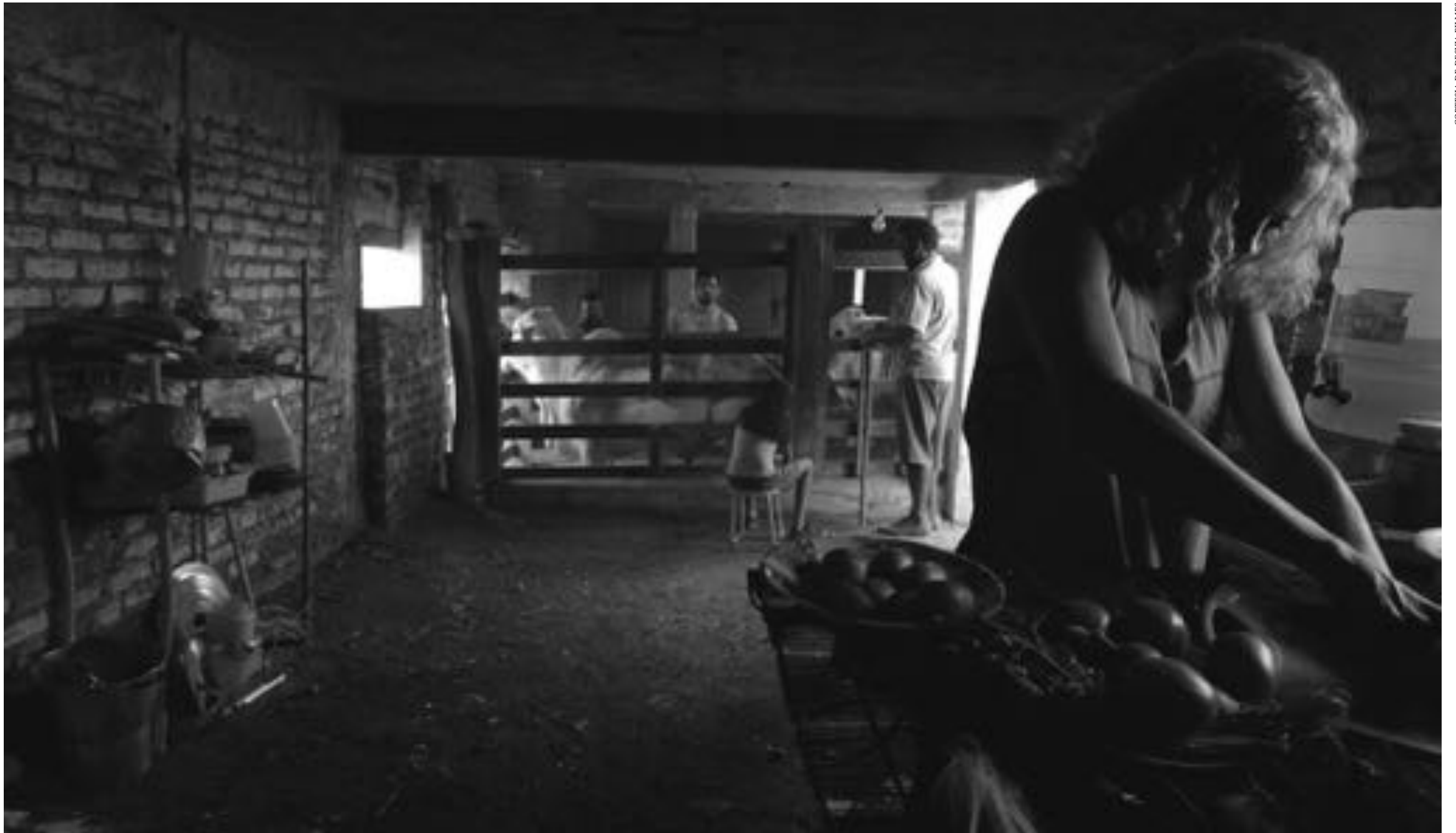
Int. Tenda da cozinha. Preparando a rabada