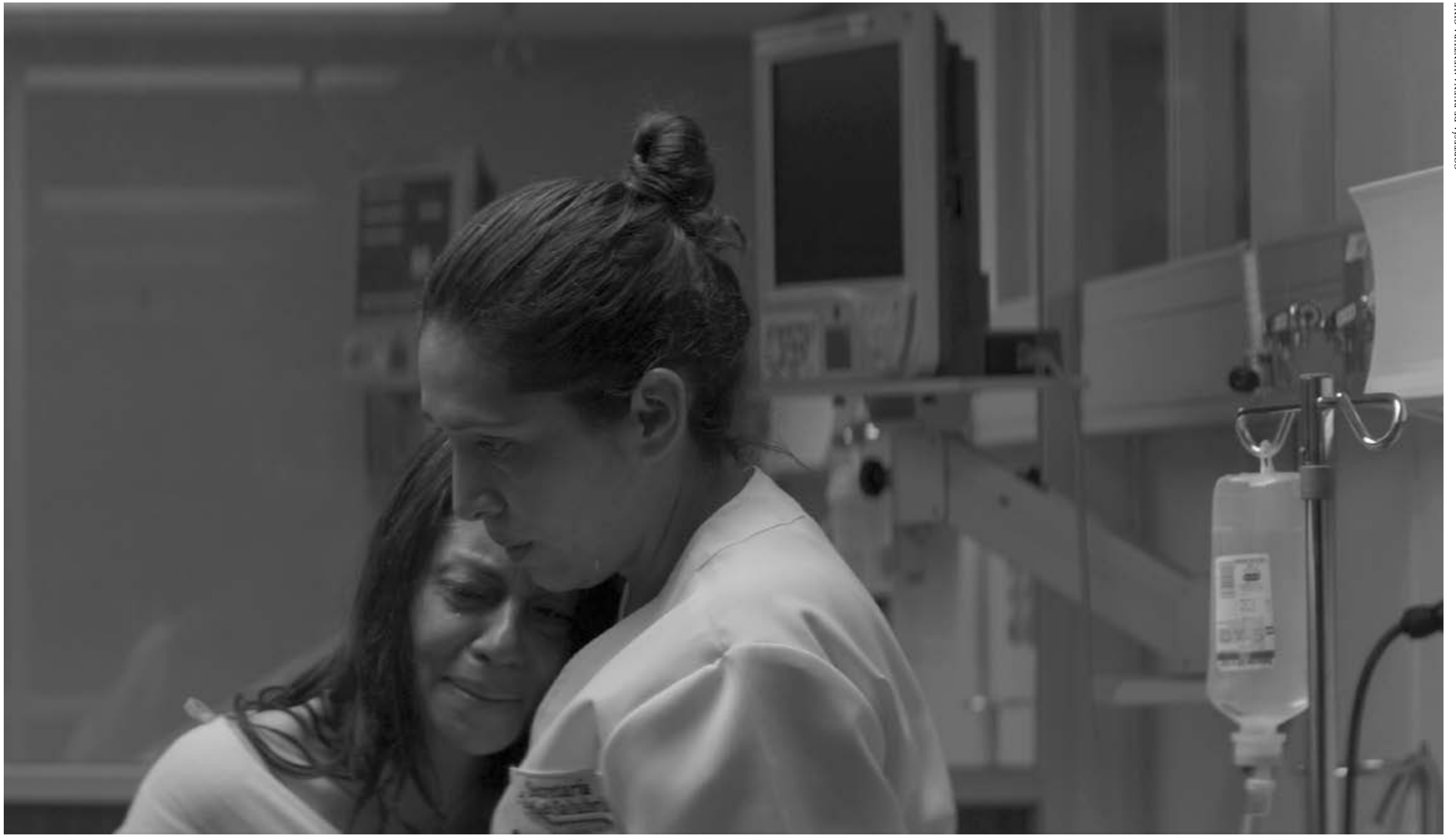
Int. Sala de cuidados intensivos. Hospital público